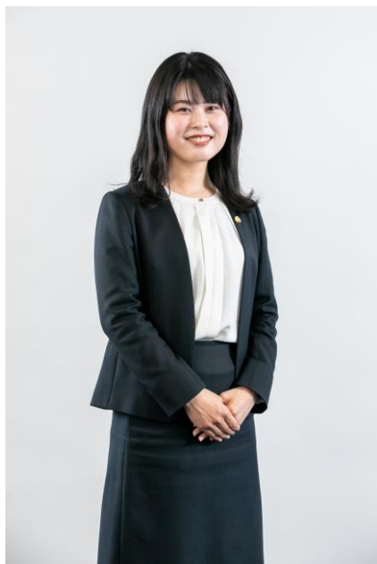
アソエイト弁護士 認定IPO実務 プロフェッショナル